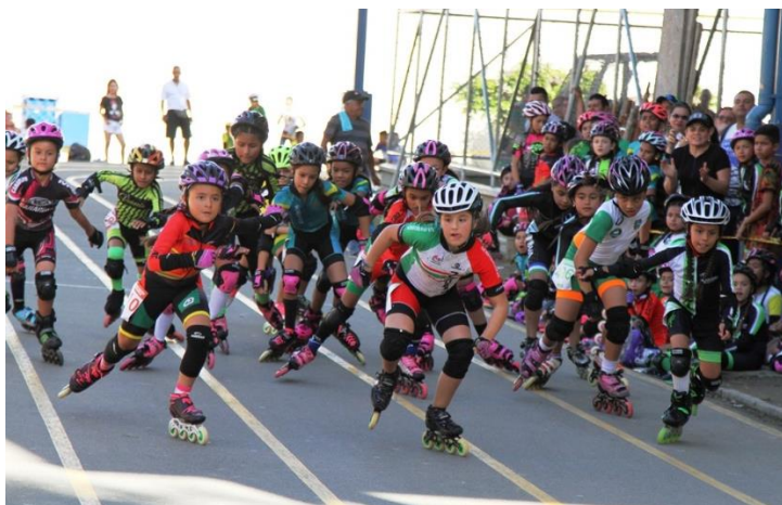
Foto. Patinaje con gran participación en Ciudad Bolívar.