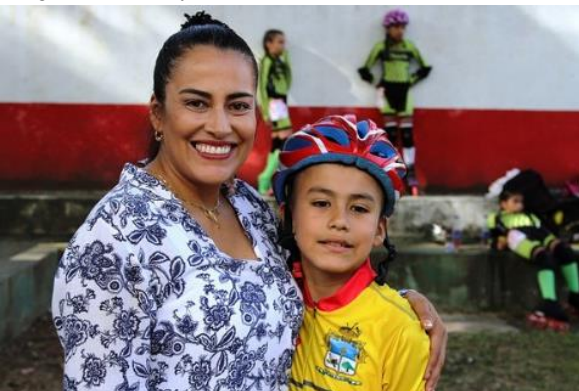
Foto. Los padres son fundamentales en el proceso.